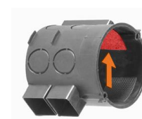
Монтаж в розетке